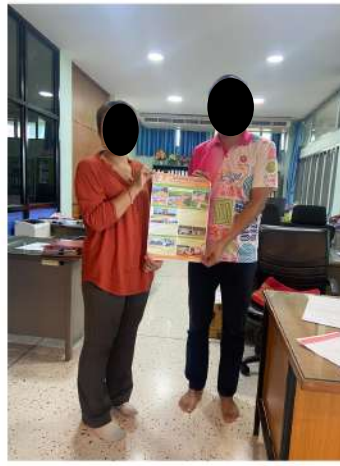
โรงเรียนโนนสูงพิทยาคาร