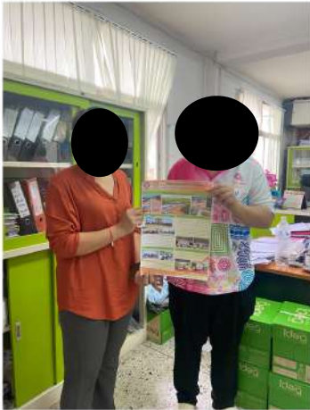
สำนักงานทรัพยากรธรรมชาติและสิ่งแวดล้อมจังหวัดอุดรธานี