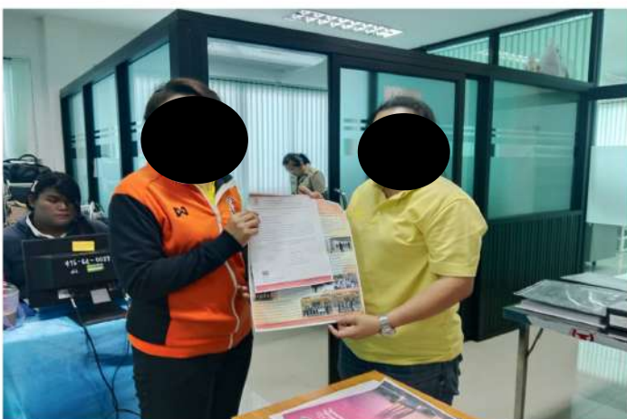
ตำบลเทศบาลหนองขอนกว้าง