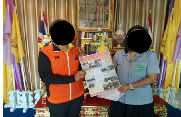
สาธารณสุขอำเภอเมืองอุดรธานี