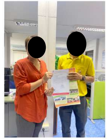
อุตสาหกรรมจังหวัดอุดรธานี