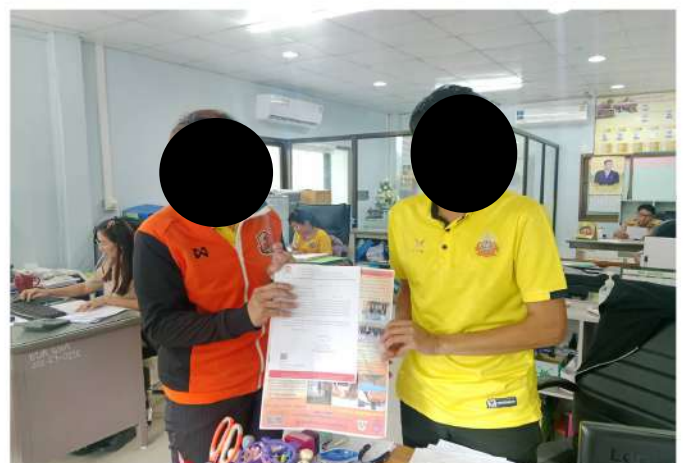
องค์การบริหารส่วนตำบลหนองนาคำ