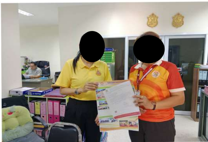
เทศมนตรีตำบลเทศบาลหนองไผ่