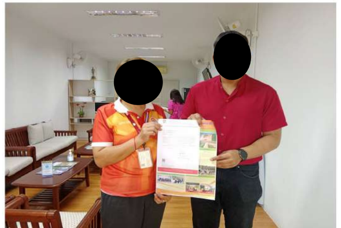
ตำบลเทศบาลบ้านจั่น