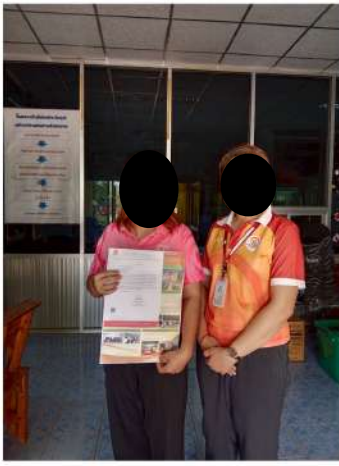
องค์การบริหารส่วนตำบลห้วยสามพาด